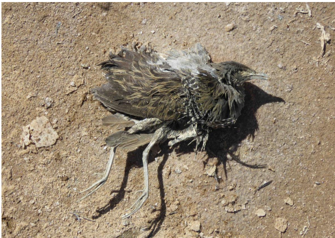
Photo 1. Face droite du cadavre du Râle des prés trouvé le 13 février 2019 en bordure de Sebkhata Skaymate