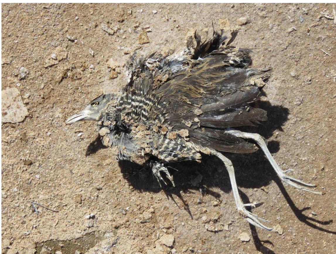
Photo 2. Face gauche du cadavre du Râle des prés trouvé le 13 février 2019 en bordure de Sebkhata Skaymate