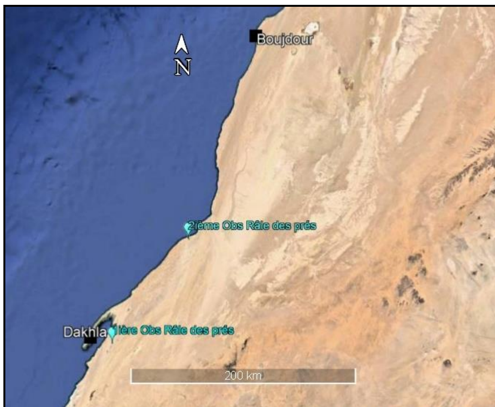
Figure 2. Localisation des deux observations de Râle des prés au Maroc