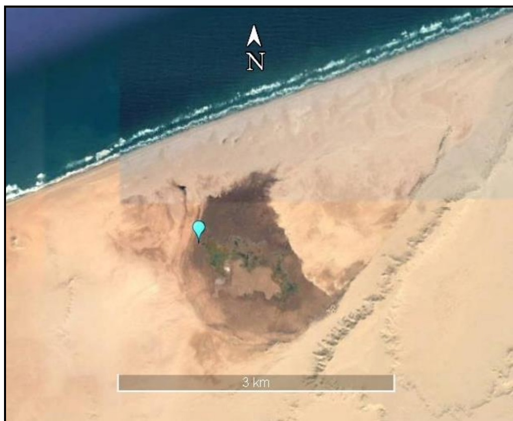
Figure 3. Localisation de la deuxième observation du Râle des prés au nord-ouest de Sebkhate Skaymate