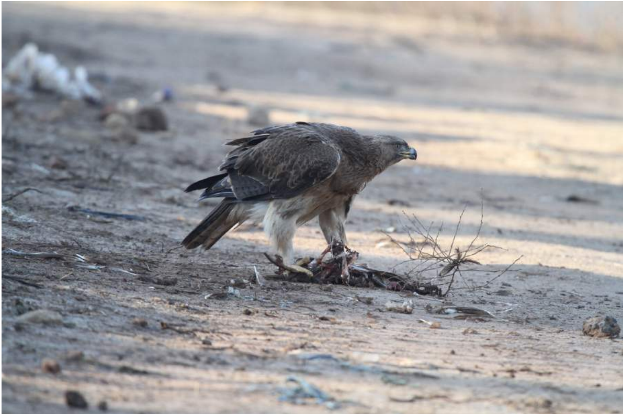
Photo 2. Aigle botté Hieraaetus pennatus dévorant une poule au barrage Hassar, 18 janvier 2017

De la même manière, la présence de Vautours fauves en 2014 (Rihane 2014) n'était pas passée inaperçue : certains riverains éleveurs avaient voulu tirer sur ces grands rapaces, pensant qu'ils pouvaient s'attaquer aux jeunes agneaux. Une campagne de sensibilisation fut indispensable pour dissiper cette peur en leur expliquant qu'ils avaient affaire à un charognard et non à un prédateur.