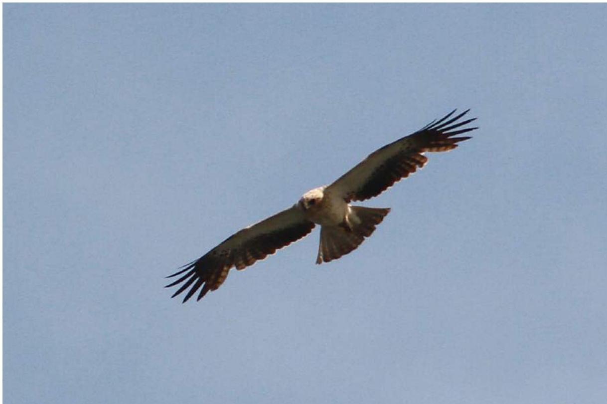
Photo 1. Aigle botté Hieraetus pennatus à l'Oued Hassar, 2 juin 2016