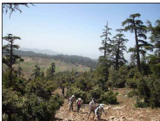
Dans la cédraie du Jbel Taghammat (X. T.).

Mammifères : une quinzaine de magots de l'Atlas Macaca sylvanus (aussi appelés macaques berbères ou macaques de Barbarie), habitués à la présence humaine près du camping du lac Azigza.