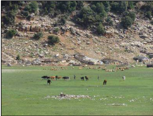
Camp berbère à l'Aguelman Ifighraoun.

Zawyat Ifrane (village et bivouac près du terrain de foot) : cigogne blanche (6 nids : 1/minaret, 1/toit, 3/arbres, 1/pylone électrique), bulbul des jardins (5+), rossignol (chanteur), merle noir (mâle), coucou gris (chanteur), serin cini (abondant), pinson (idem), chardonneret (2), tourterelle turque (2), pigeon ramier (1).