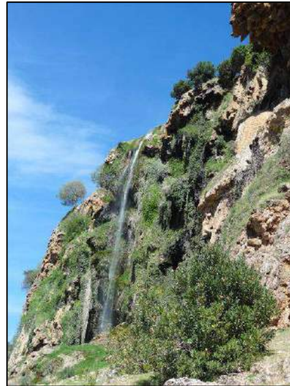
Cascade à Zawyat Ifrane (X. T.).

26 avril, de Zawyat Ifrane aux abords d'Aïn Leuh (env. 13 km en 5h30) : cheminement en milieu boisé pour monter sur le flanc nord du massif Tizamourine puis chemin en balcon (env. 1400 m d'altitude) sur piste forestière, descente sur la route bordée de vergers à la recherche du site de casse-croûte vers Aïcha Hmad, puis grimpette caillouteuse jusqu'au bivouac sur le plateau très venté de l'Ighrame Lioumine à environ 1700 m.