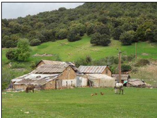
Vallée de l'oued Mirigh (Brigitte Folliot-Helen).

Amphibiens : grenouilles vertes d'Afrique du Nord Pelophylax saharicus , rainette méridionale Hyla meridionalis et un mâle de discoglosse du Maroc Discoglossus scovazzii vers 1530 m à quelques kilomètres au sud-est d'Amahroug (à l'ouest du massif de Timahsinine), un mâle de crapaud berbère Bufo mauretanicus écrasé sur la piste près du lac de Tigalmamine.