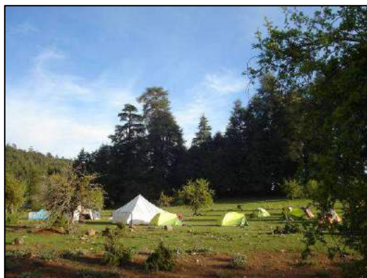
Bivouac au plateau d'Esheb (Xavier Triest).

29 avril , des abords d'Azrou à Sidi Rachid près d'Ougmas : marche facile sans grand dénivelé autour de 1750 m sur les deux premiers tiers du trajet, en suivant de larges pistes forestières (cédraie mixte) passant par des sites touristiques (Maison de la Cédraie sur la route d'Azrou à Timahdit ; Cèdre Gouraud), puis descente vers les vallées cultivées de la région d'Ougmas (environ 1550 m), bivouac vers 1510 m le long d'un cours d'eau et près d'une peupleraie à proximité du marabout Sidi Rachid (12 km en 6h30 : longs arrêts, entre autres pour les singes !).