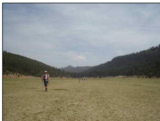
Plateau de l'Adar Oujdir (Xavier Triest).