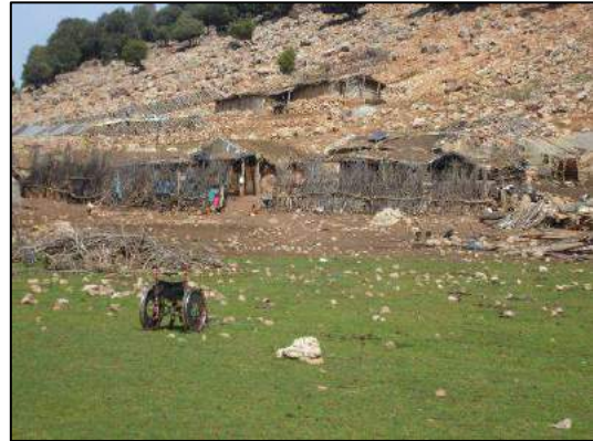
Camp berbère à l'Aguelman Ifighraoun (X. T.).