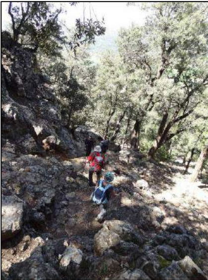
Chemin de chèvres vers Zawyat Ifrane (B. F.-H.).