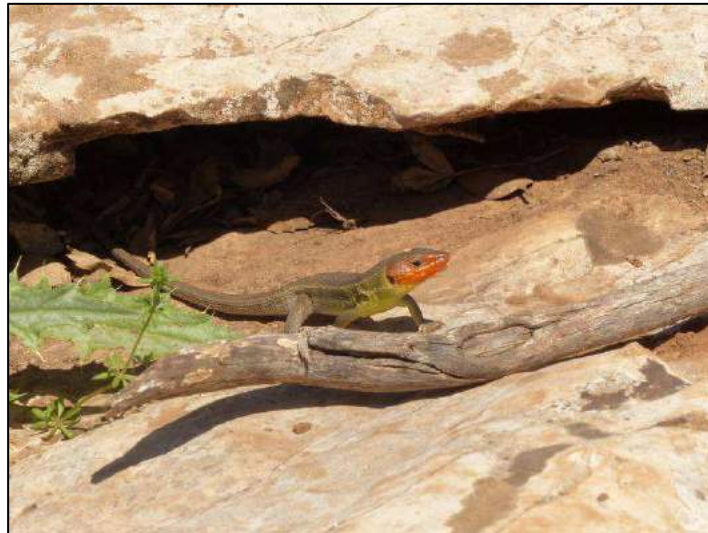
Psammodrome algire Psammodromus algirus algirus , 21 avril 2015 (Pierre Yésou).

. Crapaud berbère Bufo mauretanicus : le 21 avril, un mâle écrasé sur la piste près du lac de Tigalmamine.