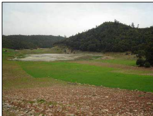
Zone humide avec foulques (Xavier Triest).