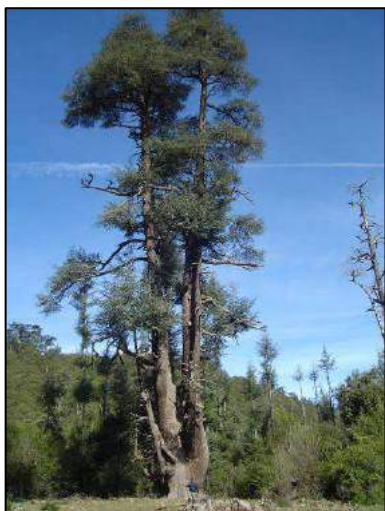
Certains cèdres échappent à la tronçonneuse (Xavier Triest).

Amphibiens : une rainette méridionale Hyla meridionalis a voyagé depuis l'Aguelman Afennourir emmaillottée dans une de nos toiles de tente, elle est relâchée en apparente bonne santé au bivouac du soir.