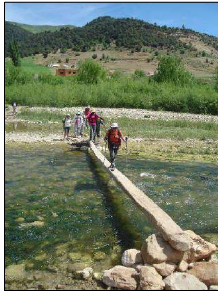
Pont (tronc de palmier) sur l'Ighzer Arassoud (Xavier Triest).