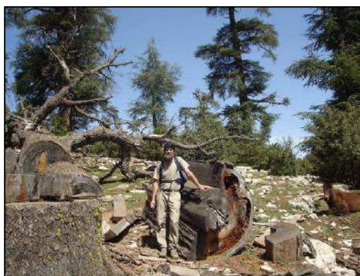
Cèdre abattu, marcheur en forme (X.T.).