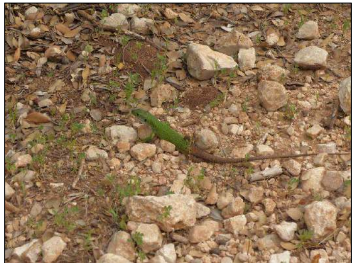
Lézard ocellé du Maroc Timon tangitanus , 25 avril 2015 (Pierre Yésou).