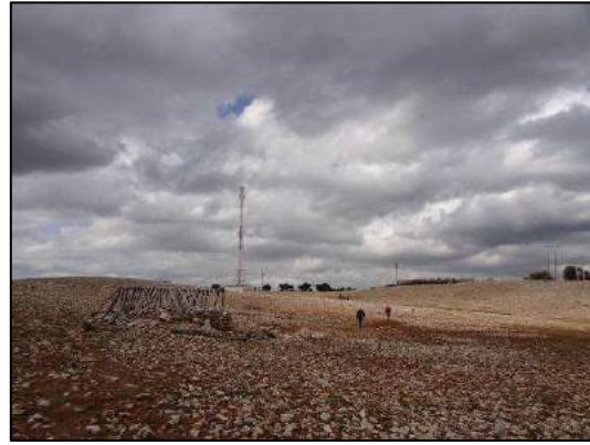
Plateau de l'Ighrame Lioumine (B. F.-H.).

27 avril, de l'Ighrame Lioumine à l'Aguelman Afennourir en passant par le plateau de Nertene (env. 14 km en 5h), puis tour du lac Afennourir pour les plus courageux (env. 7 km, 2h50) : d'abord piste en forêt (cédraie mixte) puis plateau rocailleux très sec mais parsemé de mares, le tout entre 1700 et 1800 m, traversée de la cédraie de Timziline (petit col vers 1850 m) et bivouac près de la maison du lac à 1800 m.