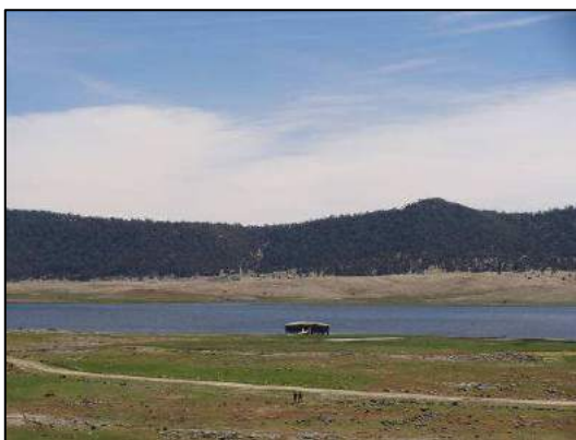
Aguelman Afennourir : l'observatoire ornithologique (Brigitte Folliot-Helen).

Amphibiens : à l'Aguelman Afennourir, nombreuses grenouilles vertes d'Afrique du Nord Pelophylax saharicus ; également rainettes méridionales Hyla meridionalis .