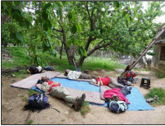
Pose bienvenue à Aïcha Hmad (B. F.-H.).