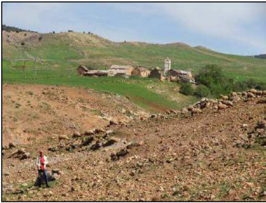
Montée vers Oughaline (Brigitte F.-H.).

Reptiles : un psammodrome algire Psammodromus algirus algirus , mâle adulte en coloration nuptiale (gorge rouge), dans habitat caillouteux avec genévriers au sud d'Oughaline (altitude environ 1600 m).