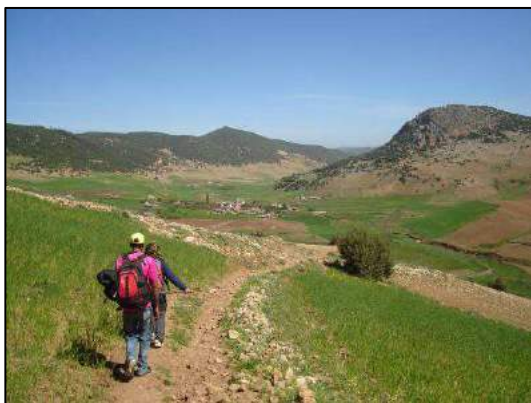
En route vers Aït Ahmed (Xavier Triest).

Amphibiens : grenouilles vertes d'Afrique du Nord Pelophylax saharicus au bivouac.