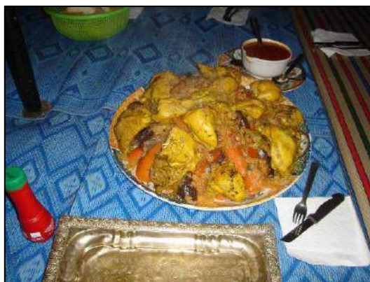
Couscous au poulet