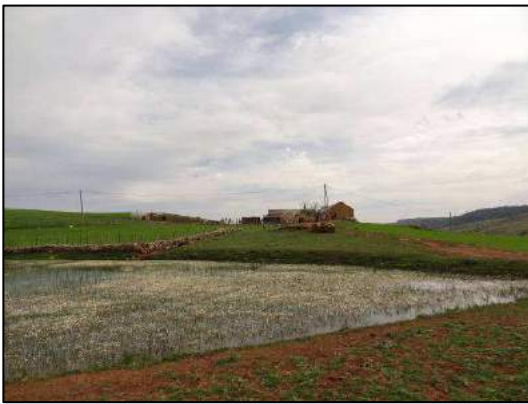
(à gauche) Etang à foulques macroules près du bivouac (Brigitte Folliot-Helen).

25 avril, des environs de l'aguelman Wiwane à Zawyat Ifrane (18 km en 7h15) : milieux rocaillieux à végétation rabougrie, herbages à moutons, grand lac dans la vallée de l'Aguelman Ifighraoun où vivent des nomades berbères relativement sédentarisés. Après une grimpette à 1700 m en début de parcours, nous restons aux alentours de 1600 m pour finir par une descente abrute le long d'un sentier à chèvres en sous-bois jusqu'à Zawyat Ifrane (bivouac à 1200 m).