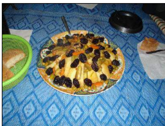
Tagine aux pruneaux

Tout au long du trajet, nous étions soignés aux petits oignons ! (Xavier Priest ; en bas à gauche : Brigitte Folliot-Helen).