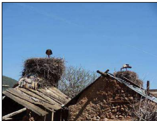
A Aït Ahmed (Brigitte Folliot-Helen).

24 avril, d'Aït ou Hadou aux environs de l'aguelman Wiwane : marche jusqu'à proximité d'Aït Mbarak dans la vallée de de l'Ighzer Arassoud (environ 14 km en 6h45), puis 8 km en camionnette pour rejoindre le bivouac situé à guère plus d'un kilomètre au sud-ouest de l'aguelman Wiwane. Paysages essentiellement agricoles entre 1300 et 1400 m, petit passage en maquis dégradé (présence de troupeaux) pour le passage d'un col à près de 1600 m au sud d'Oughaline. La fin de trajet en camionnette se fait au travers d'une belle cédraie (passage à 1800 m) avant un arrêt au lac Wiwane, puis paysage agricole jusqu'au bivouac vers 1630 m près d'une ferme et d'un petit plan d'eau.